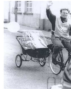
Buggy met fietskoppeling

Ter plaatse kan de buggy gemakkelijk ontkoppeld worden en als wandelwagen gebruikt worden.