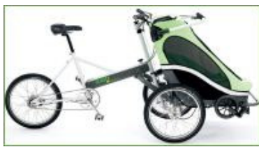
Fietsaanhangwagen vooraan de fiets gekoppeld

Bij bepaalde modellen kan de bladvering volgens het gewicht van het kind aan beide kanten ingesteld worden tot 34 kg.