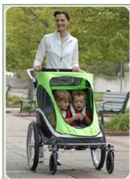
Fietsaanhangwagen met loopkit

De fietsaanhangwagen kan voorzien worden van een loopkit. Zo wordt de fietsaanhangwagen op de plaats van bestemming een wandelwagen.