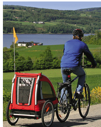
Fietsaanhangwagen achteraan de fiets gekoppeld